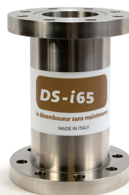
Raccord: 2 1/2"